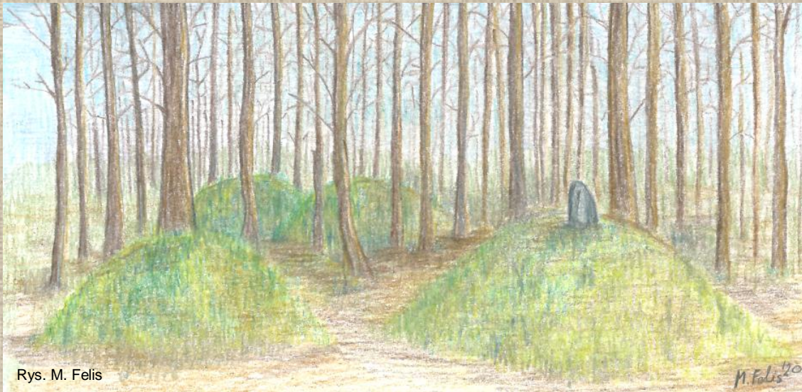
Rys. M. Felis