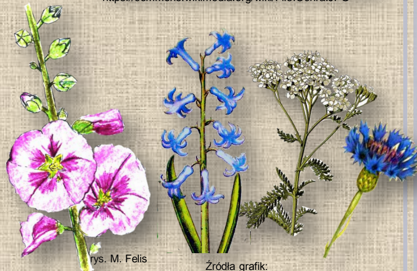
rys. M. Felis