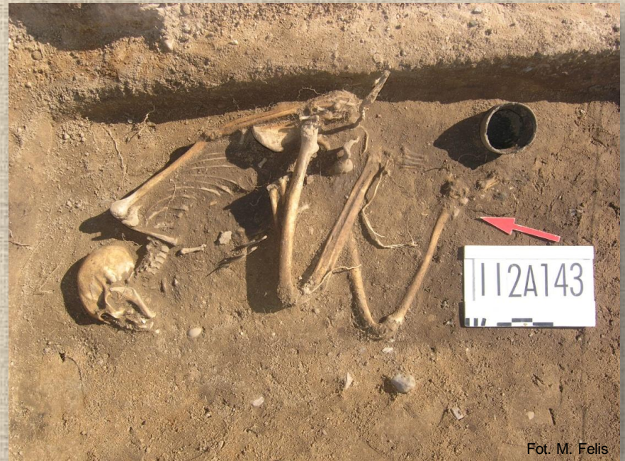
Pochówek w pozycji skurczonej na wczesnośredniowiecznym cmentarzysku w Jordanowie, gm. Świebodzin

Obok „zwykłych” pochówków, gdzie zmarły leży na wznak, spotkać można tzw. pochówki atypowe o nietypowym ułożeniu szkieletu np. w pozycji skurczonej, bez głowy lub na brzuchu. Są one różnie interpretowane, na przykład jako zabieg zapobiegający powrotowi zmarłego z zaświatów.